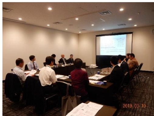
参加者によるディスカッションの様子