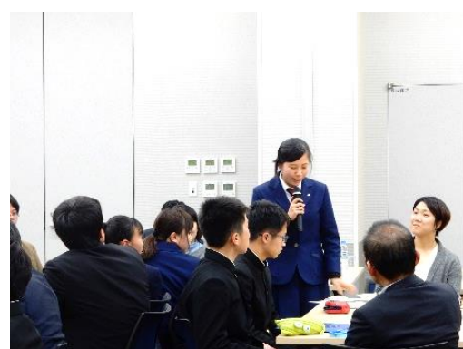
参加者によるディスカッションの様子