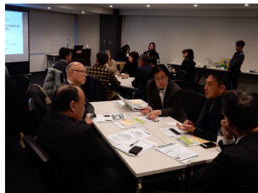
参加者によるディスカッションの様子