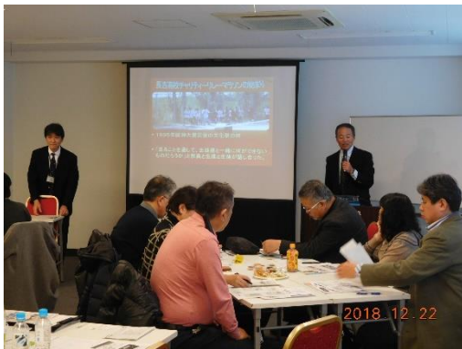
神山氏、富田氏の講演の様子