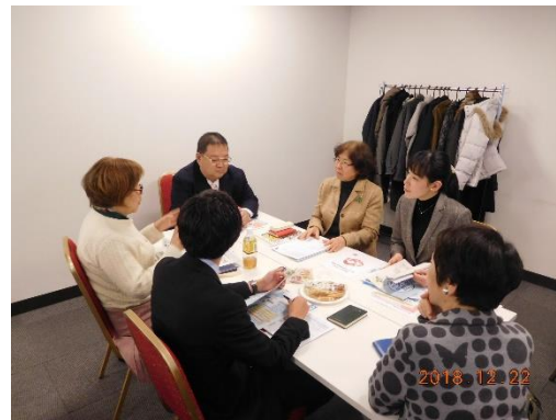
参加者によるディスカッションの様子